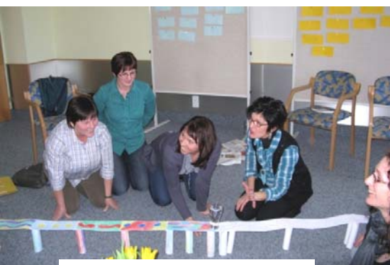
Klausur des PGR