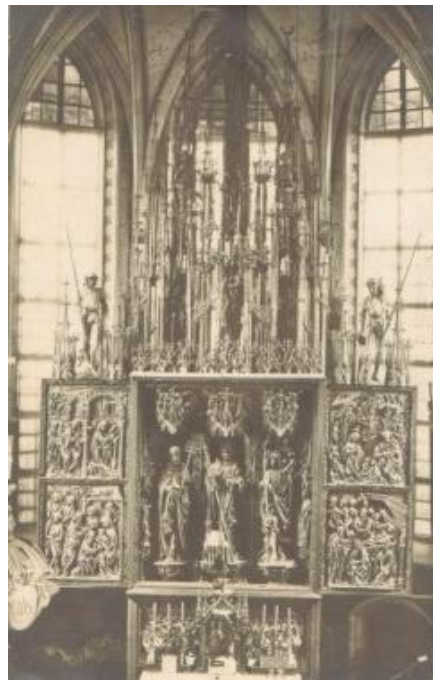
Aufnahme um 1920.

... Der Altar zu Käfermarkt hat leider durch Zeit und Barbarei viel gelitten ... Unter den Zerstörungen der Barbarei nimmt als erste die den Platz ein, dass mit Flinten unzählige Schrotte in das Holzwerk geschossen worden sind. (Mehr als eine Hand voll sind von zwei unbedeutenden Giebelsäulen gesammelt worden). Wahrscheinlich hat man nach Vögeln geschossen. Leider sind viele