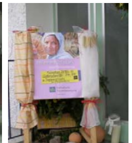
Kfb - Fastensonntag